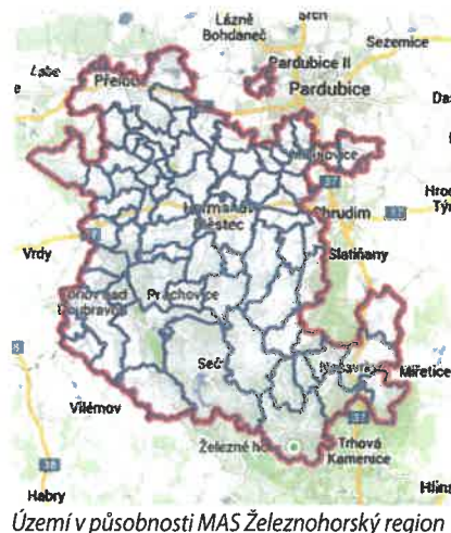
Území v působnosti MAS Železnohorský region

bylo dosaženo rozšíření objemu prací za stejnou cenu. Smluvně byla dohodnuta přelozka celé střechy a oprava celé fasády. Aby v budoucnu nemuselo dojít k zásahu do fasády byla nad rámec dotace provedena výměna oken, dveří a zabudování nové elektroskříně. Před zahájením prací byl vznesen požadavek od občanů Mladotic na změnu projektu s odůvodněním, že oprava objektu je zbytečná a nevhodná. Finanční prostředky by bylo podle tohoto názoru vhodnější investovat do oprav jiných objektů a provedení demolice obecní budovy. Na uvolněném prostoru následně zřídit park, dětské hřiště a sportoviště. Dotační podmínky Programu obnovy venkova neumožňují změny zásadního charakteru. Vzhledem k tomu, že se jednalo o poslední výzvu v rámci programového období 2007–2013, znamenalo by zřeknutí se dotace její vrácení poskytovateli (SZIF) bez jakékoli možnosti využití jiným žadatelem z našeho regionu ani žadatelem z území MAS, který byl na základě nižšího bodového hodnocení jeho projektu neúspěšný. Stanoviska občanů bylo podpořeno téměř 80 podpisy obyvatel a majitelů nemovitostí. Osobně nepovažuji od aktivistů této akce za seriózní jednání, když občany mylně, ať z nevědomosti nebo účelově, informovali o možnosti využití dotace na jiné práce. Z výše uvedeného snad jasně vyplývá, že rozhodnutí bylo pouze o dvou možnostech. Buď opravu provést v předpokládaném rozsahu nebo peníze vrátit. Druhou možností