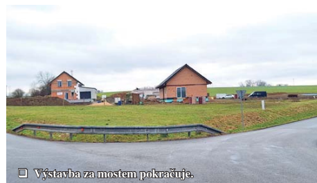
Výstavba za mostem pokračuje.