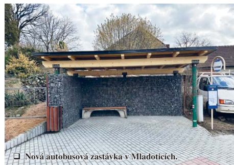
Nová autobusová zastávka v Mladotičích.