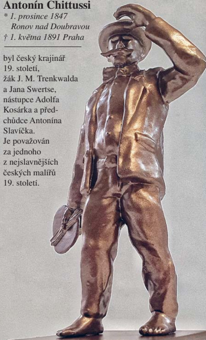
První varianta sochy Antonína Chittussiho.

byl český krajinář 19. století, žák J. M. Trenkwalda a Jana Swertse, nástupce Adolfa Kosárka a předchůdce Antonína Slavíčka. Je považován za jednoho z nejslavnějších českých malířů 19. století.