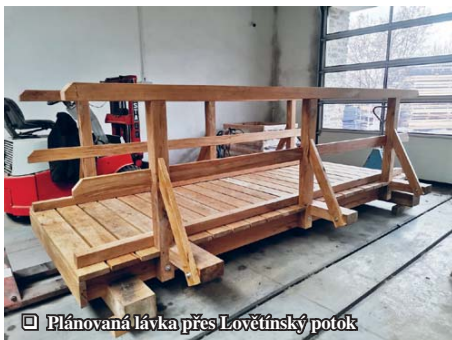
☑ Plánovaná lávka přes Lovětínský potok