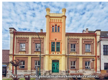
Na jaře se bude pokračovat v rekonstrukci radnice.