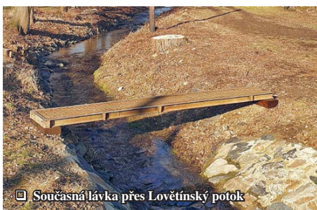
☑ Současná lávka přes Lovětínský potok