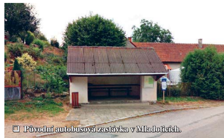
Původní autobusová zastávka v Mladotičích.