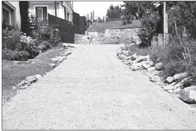
☐ Na Podhorce se pokračuje s opravami štětových cest.