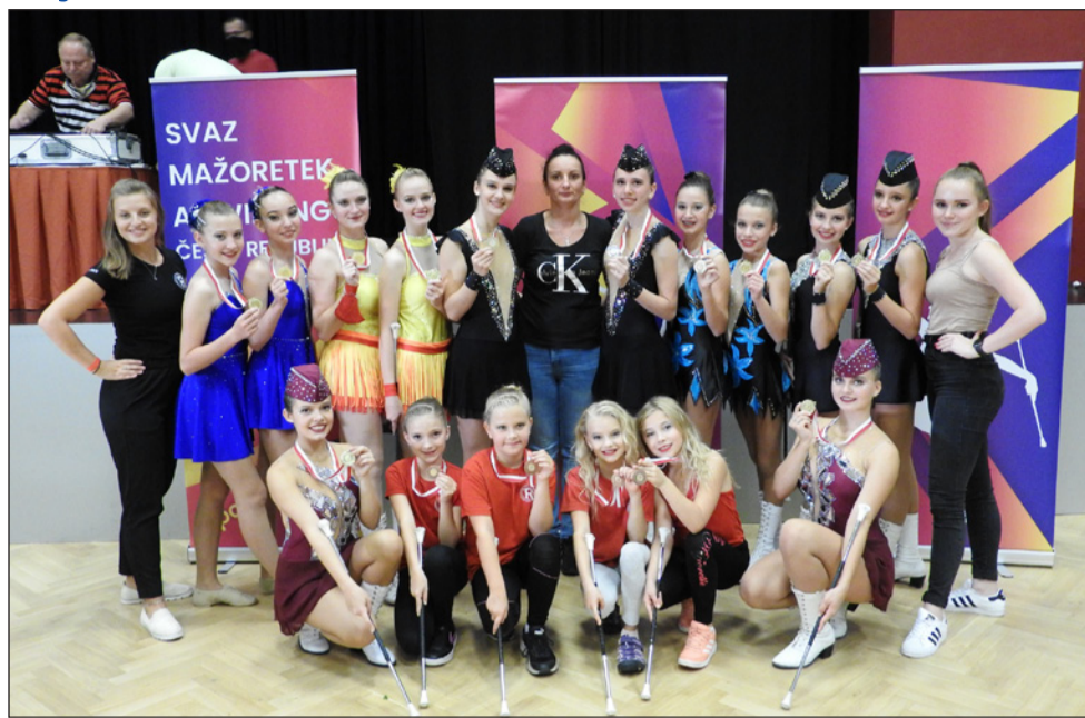
□ Září 2020, Benešov