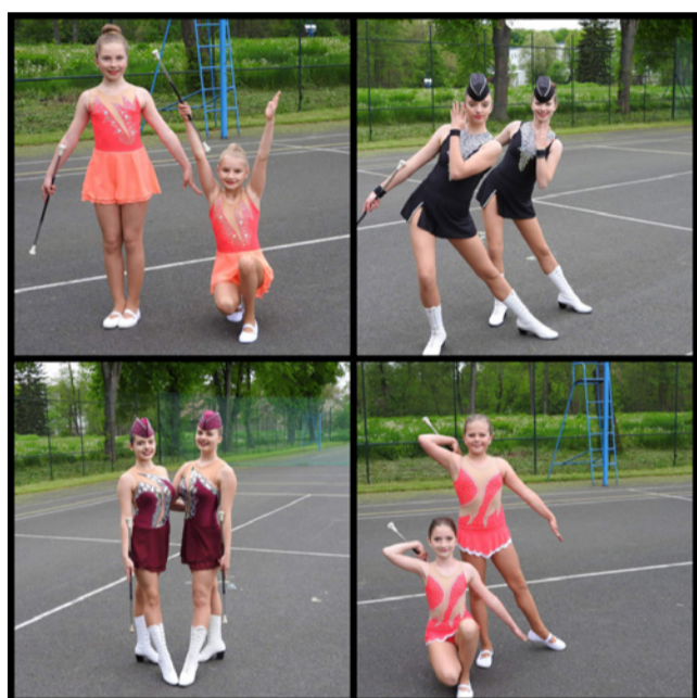
□ on-line SMTČR dua