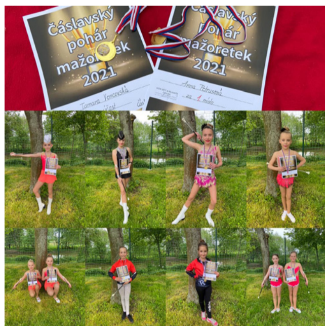
□ Reprezentanky Čáslavského poháru