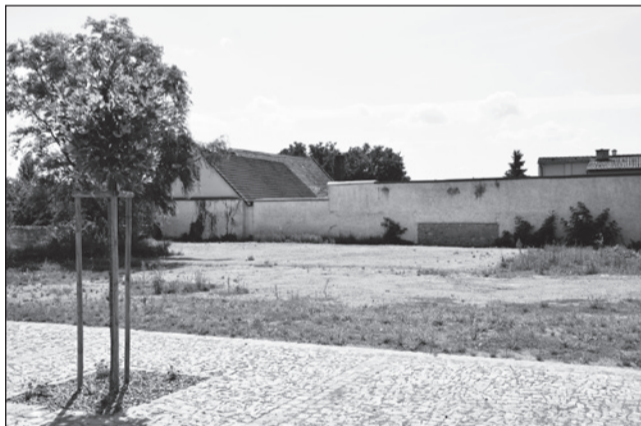
☐ Ve východní části náměstí se připravuje prostor pro dětské hřiště.