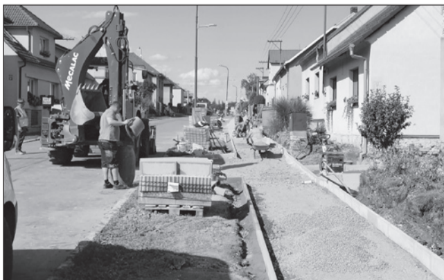
☐ Dlouho očekávaná rekonstrukce chodníku v Nádražní ulici se blíží do finále.