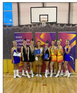
□ Ronov, červenec 2021, soutěžící dua