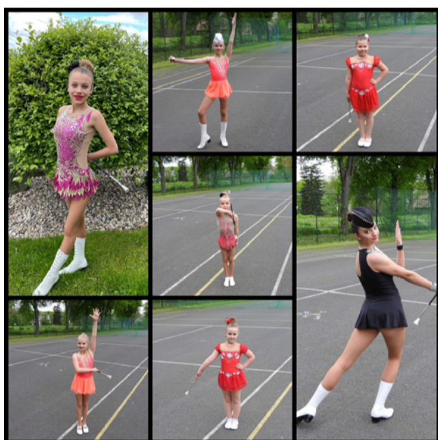
□ on-line SMTČR sóla