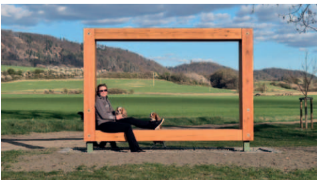
V rámci projektu MAS se realizoval fotopoint s možností fotografie s krajinou Železných hor.