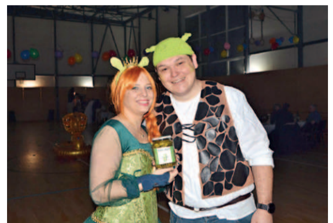
Na druhém místě se umístil pohádkový pár Shrek s Fionou.