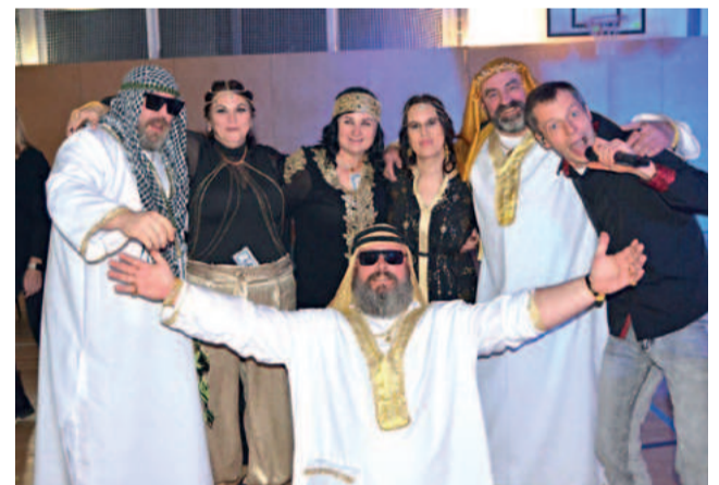
A první příčku si po obřím potlesku právem zasloužil gang šejků.

I když byl letošní ročník poznamenán nižší účastí, nikomu to nevadilo. Největší devízou tohoto večera byla skvělá nálada, která vládla mezi účastníky.