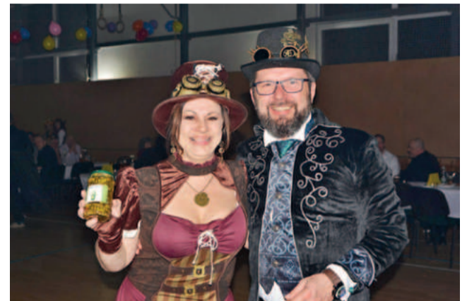
Po bouřlivé debatě třetí místo obsadil steampunk.

Dne 15. února ožila tělocvična ZŠ maškarní zábavou. Volnočasová Kulturní Ronovská Komise VoKu(R)Ko uspořádala třetí ročník šibřinek. O hudební produkci se postarala kapela Starý Klády, která tradičně zahrála od každého žánru kousek. Hned prvním songem dostala spoustu návštěvníků na parket. Za komisi můžeme říct, že letošní šibřinková noc byla opravdu plná fantazie. Sešla se velká spousta nápaditých masek. Jako v předchozích ročnících se i letos bojovalo o nejlepší kostýmy. Bylo pro nás hrozně těžké vybrat ty nejvyčytanější, nejtupnější prostě neoriginálnější.