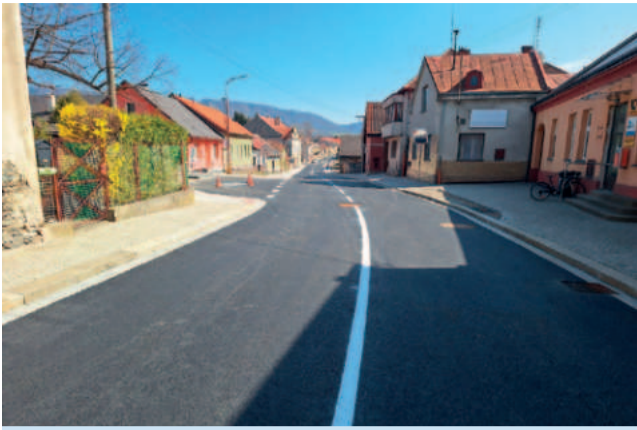
Dne 1. 4. 2025 byla otevřena opravená silnice mezi lékárnou a starou poštou.