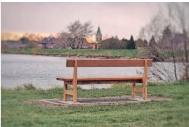
U rybníka Nový byly umístěny nové lavičky.