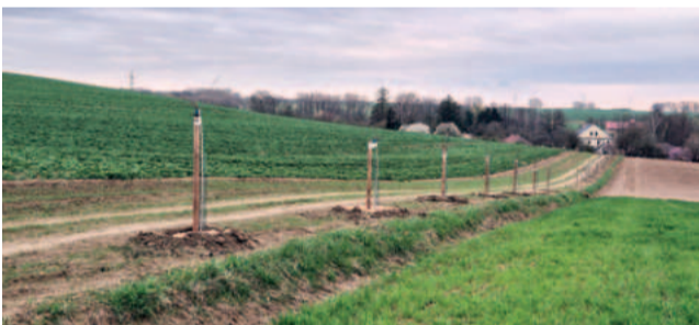
Nová cesta od Korečnicku k Lovětínskému potoku. Bude travnatá s alejí z ovocných stromů. Projekt spolufinancovala MAS Železné hory.