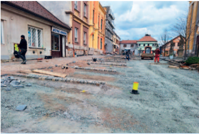
Práce na rekonstrukci části náměstí pokračují.