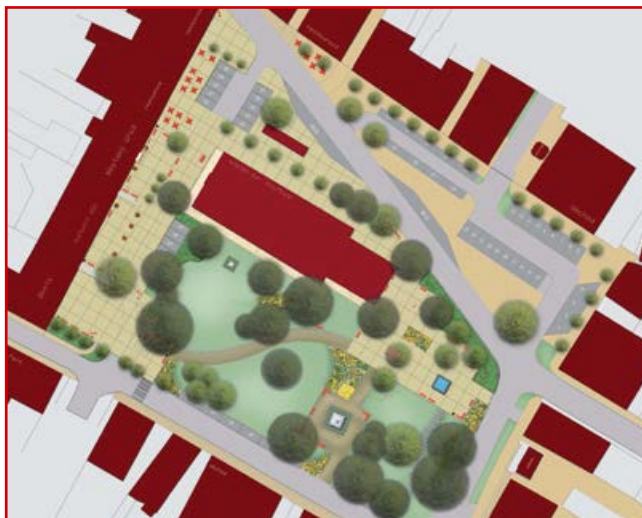
Studie náměstí. V první etapě bude realizován park a přilehlá parkovací místa.