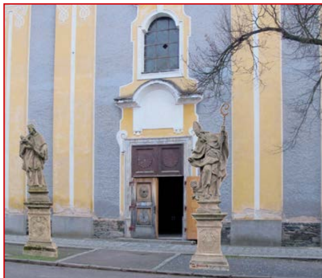
Vizualizace případného nového umístění